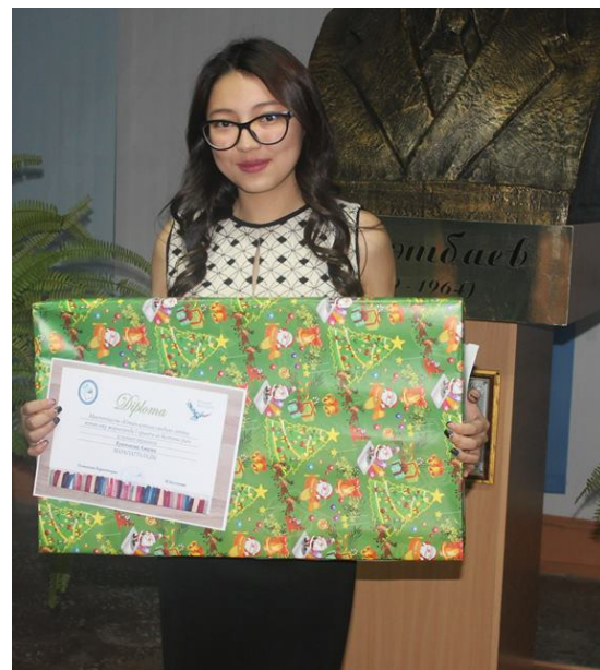
"Балауса" газетінің тілшілері

Бір ай бұрын жарияланған жарыс 2 турдан тұрды! 1-тур оқылған шығармаға рецензия жазу болса, 2-тур тест сұрақтары! Барлық жеңімпаздарға дипломдар мен тиесілі бағалы сыйлықтары табыс етілді. Жұлделеріңіз құтты болсын!