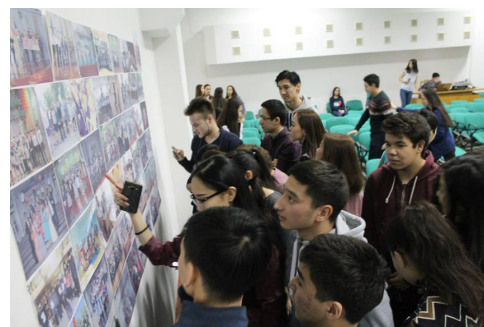
"Балауса" газетінің тілшілері